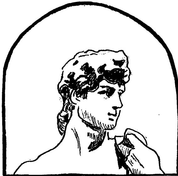
Michelangelo: David - osa marmoriveistosta 1501-04, Firenze.

en nähnyt seinämällä ainoatakaan kuvaa minusta.